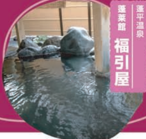
蓬平温泉 蓬菜館 福引屋