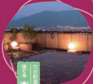
六日町温泉 ほてる 木の芽坂