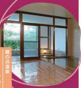
鶴の浜温泉 高台の宿 三景